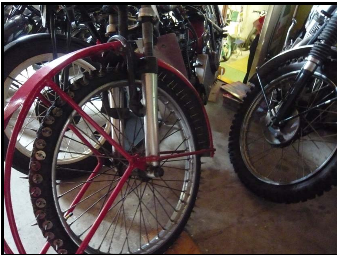
Fra Hedemora MC-museum – motorcykel til isbane-racing