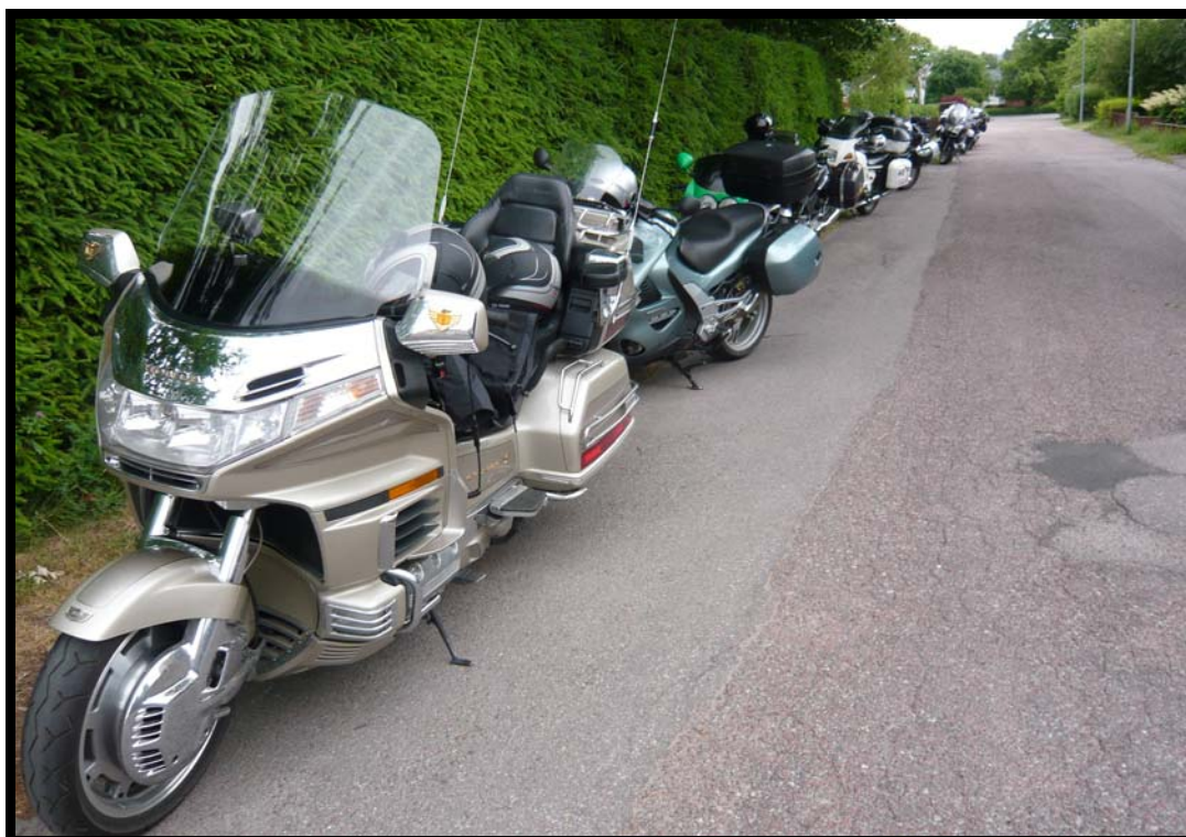
MC-opstilling udenfor MC-museet i Hedemora