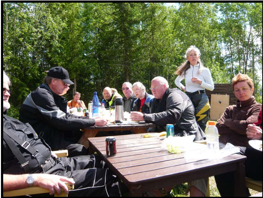
Frokostpause ved Långshyttan