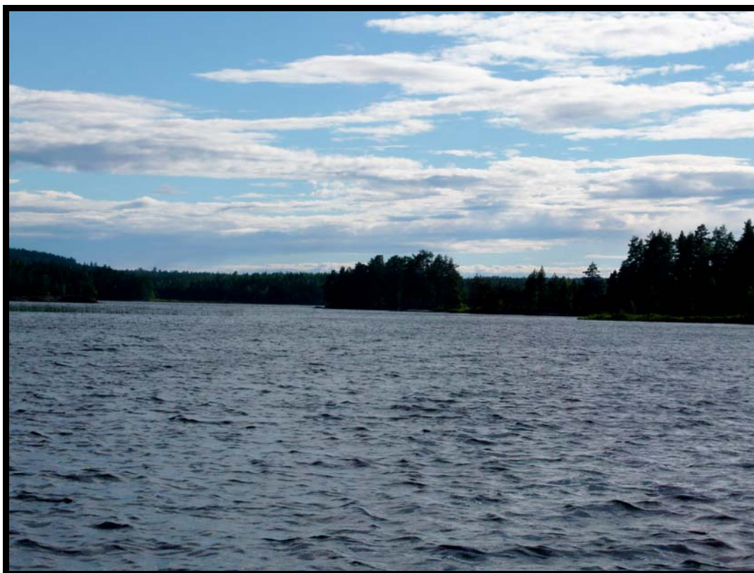
Aftenstemning ved Spejderhytten