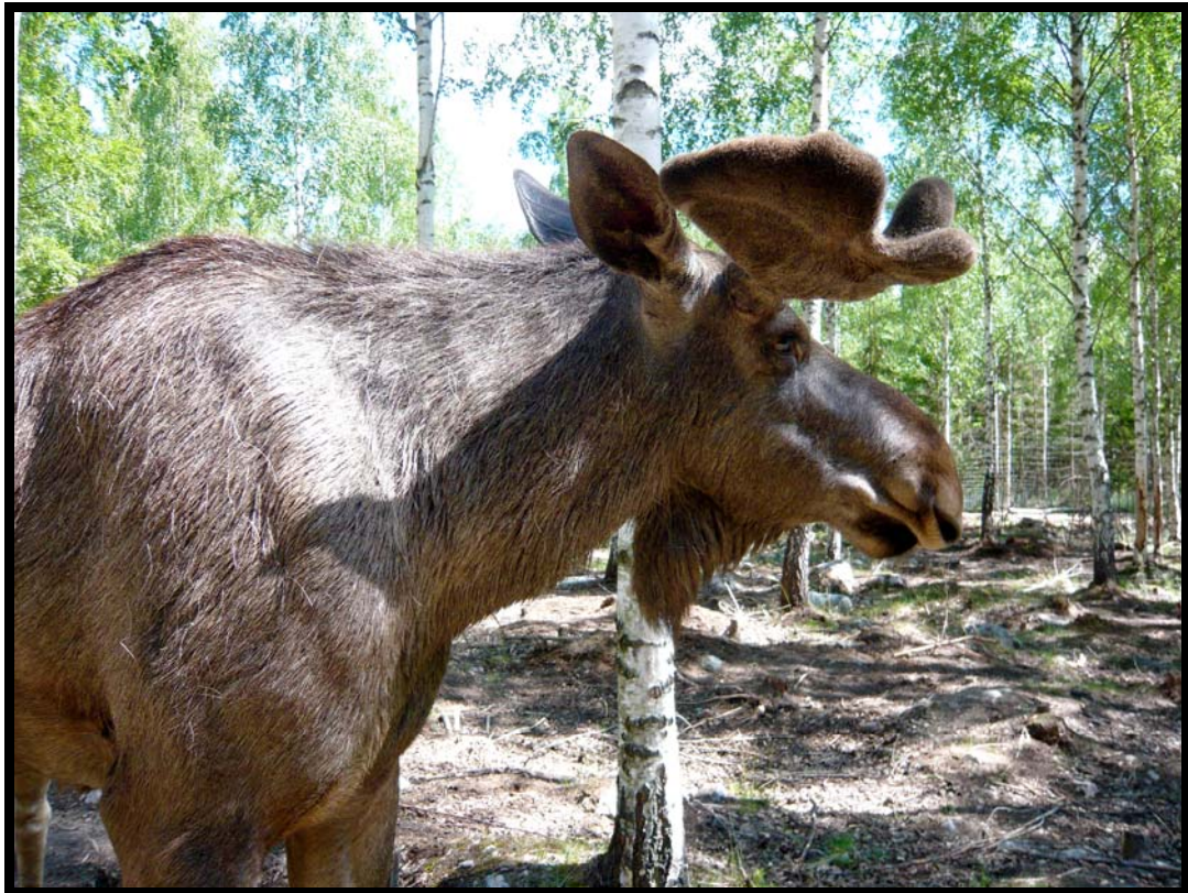
Elgen Elvis i Långshyttan