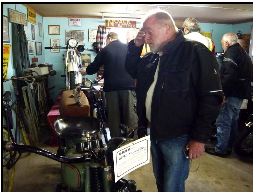
Jan i MC-museet i Hedemora