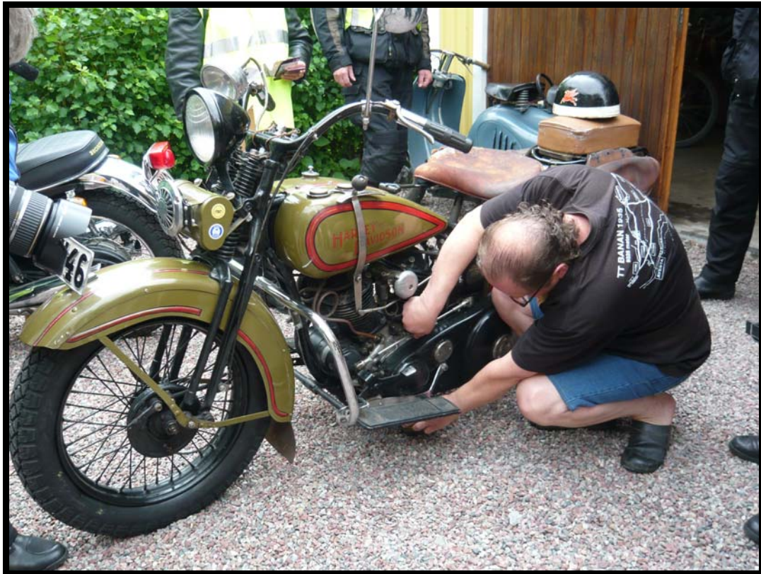
Harley Davidson fra 1931 startes.