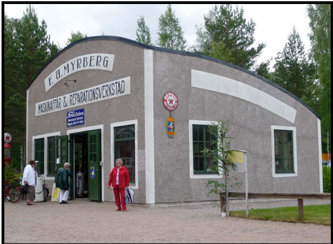
Fra Hembygdgården i Norberg