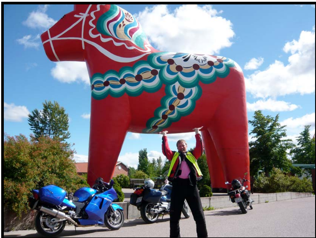
Verdens største DALA-hest i Avesta